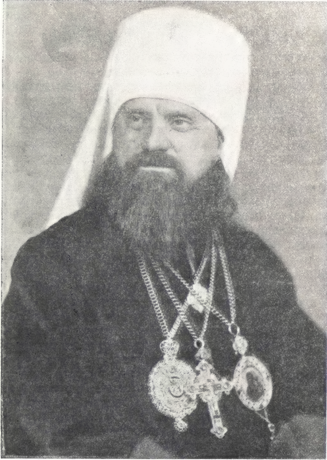
ЕЛЕВФЕРИЙ, Блаженнейший Митрополит Пражский и вся Чехословакии